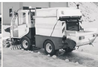
Schneekehrwalze und Walzenstreuer

Für das Beseitigen von Schnee auf schmalen Straßen und Gehsteigen ist das Schneeräumschild bestens geeignet.