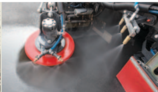
Wasserdüsenpaket zur perfekten Feinstaubbindung (PM 10) - Option

Der stufenlos regelbare Hochleistungsventilator kann aufgrund seiner großzügig ausgelegten Dimensionierung mit einer niedrigen Drehzahl betrieben werden und steht für ein niedriges Geräuschniveau.