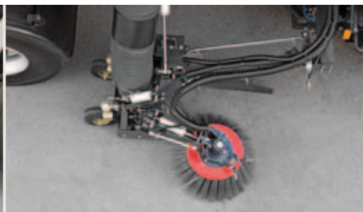
Flexible Kehrbreite - teleskopierbares Kehrgutaufnahme-Aggregat

Die geschobenen Tellerbesen werden pneumatisch gesteuert. Das ausgefahrne Kehraggregat ist vom Fahrer jederzeit gut einsehbar.