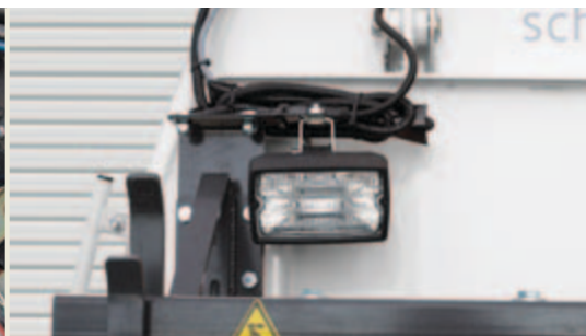
Arbeitsscheinwerfer am Heck des Kehrgutbehälters - Option

Zur verlässlichen Feinstaubbindung (PM 10) dient eine innovative Zusatzbedüsung. Das Wassersystem kann auf Wunsch werksseitig mit diesem optionalen Element ausgestattet werden.