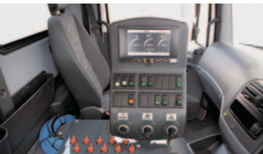
Komfortables Power Sweep System (PSS)

Funktionaler Serienumfang Eine separate Bedieneinheit mit Joystick für sämtliche Standard-Kehraggregatfunktionen im Bereich der Fahrertür sowie eine Kabelfernbedienung für alle Behälterfunktionen gehören ebenfalls zum Serienlieferumfang.