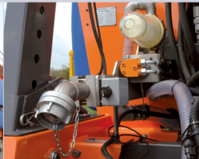
Sole-Pumpe aus Bronze (mit Trockenlaufschutz) inkl. großflächiger Filtereinheit. Verrohrung kpl. aus rostfreiem Edelstahl.