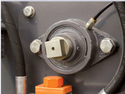
Zentralschmierung der Förderschneckenflanschlager und Drehhilfe für die Förderschnecke.