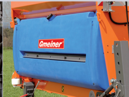
Flüssigkeitstanks Seitlich angebrachte Behälter aus besonders schlagfestem Material. Optische Anzeige für den Füllstand.