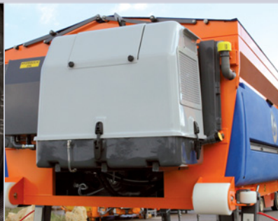
Aufbaumotor Wahlweise mit Ein- oder Zweikreis-Hydraulik.